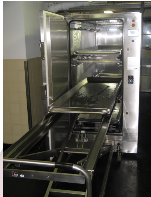
Automatisches Be- / Entladen der SprayCon-Anlage

Es ist von großem Vorteil, dass jeder zu konservierende Körper vorab mit einem / unseren Perfusionssystem („Perfu“-Tek) eine Innenfixierung erhält. Diese Prozedur eliminiert die Körperflüssigkeit, die sich sonst mit der Prozesslösung mischen und diese verunreinigen würde, was wiederum negative Auswirkungen auf den pH-Wert hat. Zu diesem Zweck dient ein abgesaugter Balsamierungstisch und unser „PerfuTek“ System. Dieses System beinhaltet eine Pumpe mit verstellbarem Druck, einen 50 Liter-Container für Prozesslösung und 3 verschiedene Perfusionsnadeln für die Injektion der Konservierungslösung. Diese Operation bedingt auch die Etablierung einer ca. 15mm großen Öffnung im Stirnbereich des Körperspenders, um einen guten Durchfluss der Lösung durch den Körper zu garantieren. Ohne diese Vorfixierung der inneren Organe etc. mit dem „PerfuTek“-System dauert die Infiltration sehr viel länger, ist evtl. nicht so intensiv und qualitativ nicht so hochwertig.