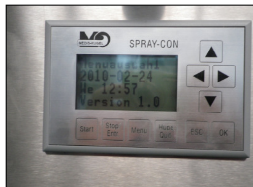
Steuerung der SprayCon-Anlage mit Warnmeldung

Hergestellt in Deutschland von MEDIS MT GmbH gemäß ISO 9001 und den gültigen EN-Normen sowie Arbeitsschutz- und Sicherheitsbestimmungen.