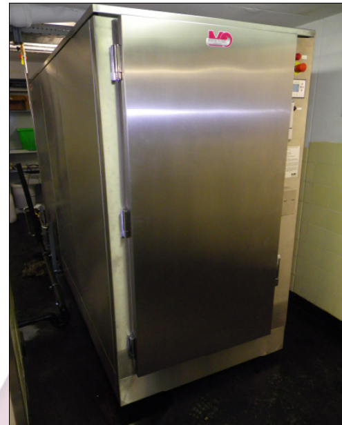
SprayCon 5000-3 (Modul für 3 konservierte Körper)