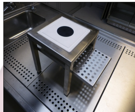
Zuschneidetisch mit Zuschneideplatte und Instrumentenablage