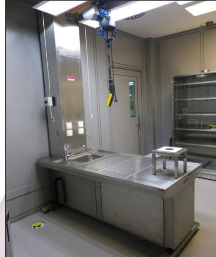
MA-2069 Tier-Sektionstisch mit Abluft und Kranbahn für optimale Kadaver-Positionierung

1 x Kranbahn für optimale Positionierung der Kadaver vor der Sektion.