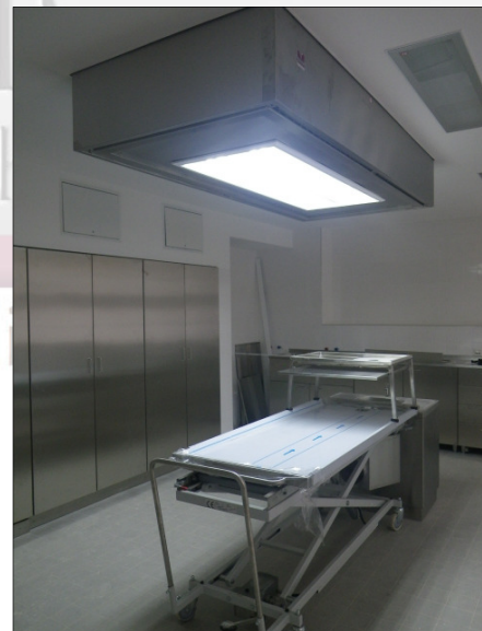
MA-2018 Deckenleuchte in rechteckiger Ausführung