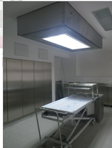
MA-2016 Zuluft-Element mit Beleuchtung in Zwischendecke eingelassen