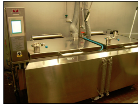
MA-1366 mit zwei Prozesskammern

Sicherheitsgriffe am Deckel, die keine Wärme aufnehmen.