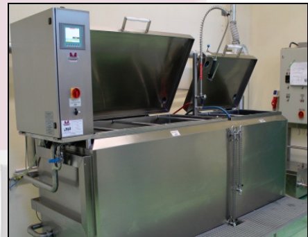
MA-1366 mit geöffnetem Deckel und Auftrittspodest