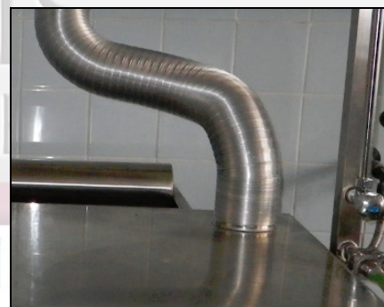
Anschluss an haus eigene Ventilation