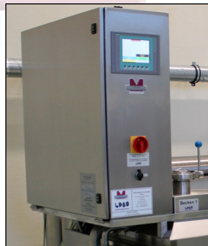
Touchscreen-Panel zur Programmierung. Texte in deutscher Sprache