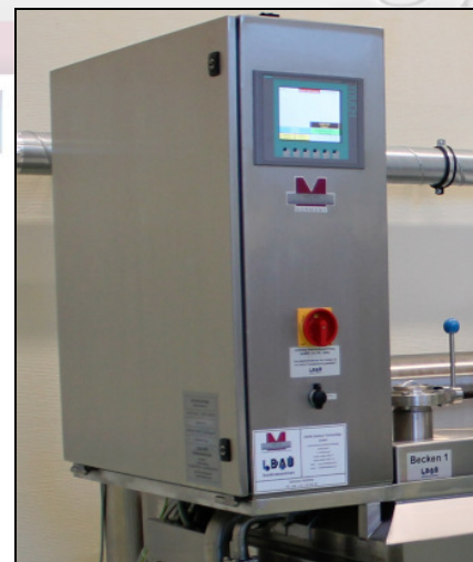
Touchscreen-Panel zur Programmierung. Texte in deutscher Sprache