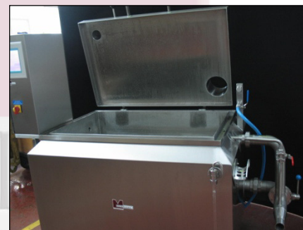
MA-1360 mit geöffnetem Deckel