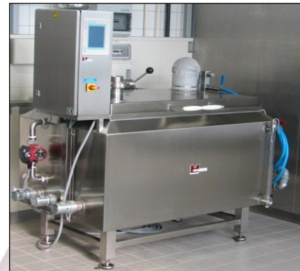
MA-1360 mit einer Prozesskammer

Sicherheitsgriffe am Deckel, die keine Wärme aufnehmen.