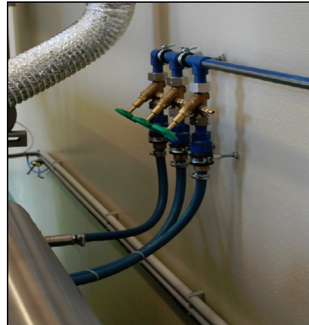
Beispiel des Zulaufs an einer Mazerationsanlage mit 2 Kammern (mittlerer Hahn zur Versorgung der Brause)

Hergestellt in Deutschland von MEDIS MT GmbH gemäß ISO 9001 und den gültigen EN-Normen sowie Arbeitsschutz- und Sicherheitsbestimmungen.