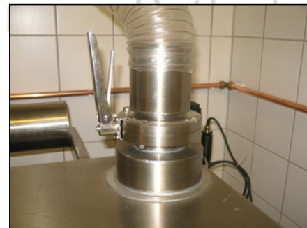
Abluftsystem über hauseigenen Ventilator