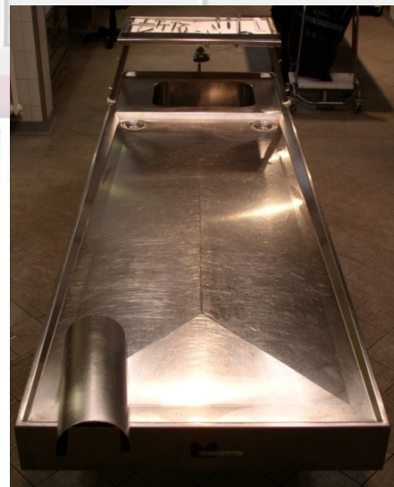
MA-0982 mit positiv (konvex) geprägter Arbeitsfläche und zwei Restebecken (rund)