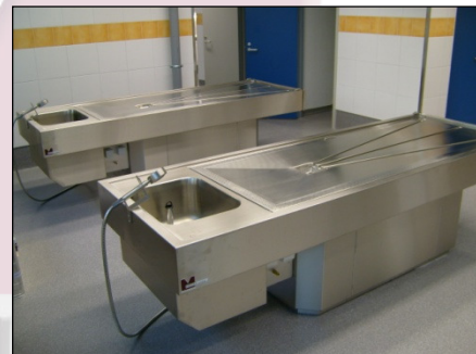
MA-0982 Seziertisch mit eckiger Säule und Höhenverstellung per AUF- / AB-Schalter

Mittelsäule mit Revisionstür für leichte Zugänglichkeit zu Sanitärinstallationen. 2 x Schuko-Steckdosen. Wasserdichte Silikon-Abdichtung der Säule im Bodenbereich verhindert das Eindringen von Flüssigkeit / Bakterien in den Innenraum.