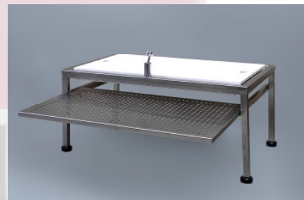
MA-0985 Organtisch mit Zuschneideplatte, Instrumententray und Halter für Schlauch- brause