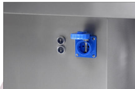
MA-0985 Höhenverstellung per Schalter AUF / AB und IP55 spritzwassergeschützte Steckdose