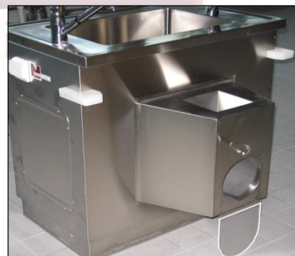
Einfach-Andocksäule für 1 Präpariertisch