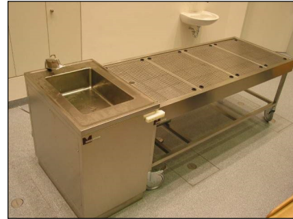
Studenten-Präpariertisch mit perforierter Arbeitsfläche und Absaugung nach unten. Angedockt an Andocksäule

Dieses Sicherheitsseitenwand-Abluftsystem wird exklusiv von MEDIS MT standardmäßig verwendet.