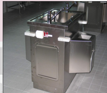
Doppel-Andocksäule für 2 Präpariertische