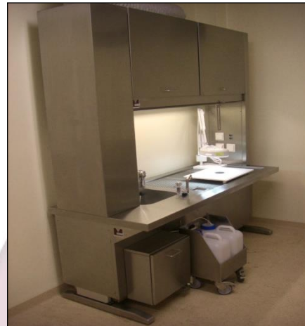
MacroDoc 880 Station (Wandposition)