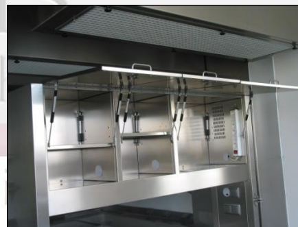
Ansicht Überbau der MacroDoc-Station MA-0880