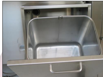
Absaugter Abfallbehälter für MA-880