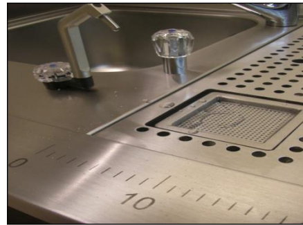
MacroDoc-Station mit Frischformalin-Spender

Bauseitig muss der Wasseranschluss der DIN EN 1717 und DIN 1986-100 entsprechen.