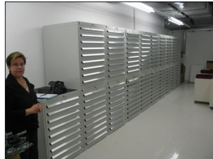
„HistoFile“ – Anlage für ca. 0,5 Mio. Gewebeblöcke