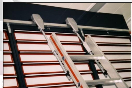
„HistoFile“- Anlage mit Spezial-Sicherheitsleiter