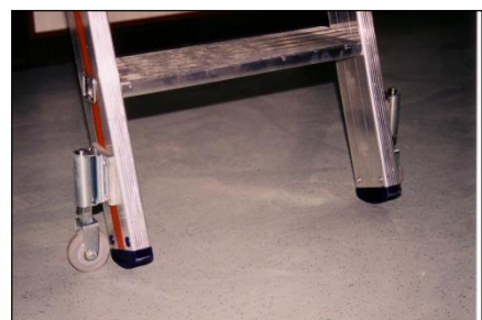
Feststell-Mechanismus der Sicherheitsleiter